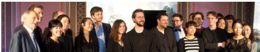
Participants et lauréats des Master classes 2019

Quatuor à cordes : 3 000 € / Soliste : 1 500 € / Ensemble instrumental : 1 500 €